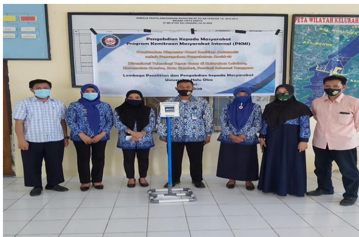
Gambar 3 Diseminasi Dispense hand sanitizer di Kelurahan Lalolara, Kecamatan Kambu, Kendari

Gambar 3 memperlihatkan dokumentasi kegiatan diseminasi alat di lokasi mitra sasaran yang dirangkaikan dengan pelatihan penggunaan dan perawatan dispenser hand sanitizer otomatis terintegrasi pendeteksi suhu tubuh. Dari hasil kuesioner yang diberikan kepada peserta dalam hal ini adalah staf kelurahan dan sebagian masyarakat peserta kegiatan di kelurahan Lalolara, diperoleh bahwa penerapan dispenser hand sanitizer otomatis ini sangat bermanfaat untuk memutus mata rantai penyebaran Covid-19 serta penggunaan dispenser hand sanitizer inisangat mudah sehingga direkomendasikan untuk dapat diterapkan di tempat-tempat fasilitas umum lainnya khususnya di kota Kendari.