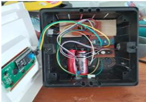
Gambar 1(a) Tampak bagian dalam panel dispenser

memperlihatkan lebih detail tentang komponen utama dispenser hand sanitizer, dimana Gambar 2a ialah rangkaian untuk hand sanitizer otomatis dan Gambar 2b ialah rangkaian untuk pendeteksi suhu tubuh.