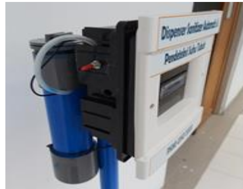
(b) Tampak bagian luar panel dispenser