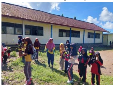
Gambar 1.3 Pembibitan di belakang SDN Bunpetung

Pengambilan bibit dilakukan pada hari Rabu, 4 Januari 2023 di BPDASHL Dodokan Moyosari untuk dibagikan di setiap dusun (kadus). Tim KKN melakukan pemisahan bibit untuk sekolah dan warga desa prabu dengan perantara masing masing kepala dusun (Kadus) dan pemerintah desa , kemudian di hari selanjutnya tim knn membagikan bibit tersebut ke rumah masing-masing kepala dusun dan melakukan penanaman bersama SDN Bunpetung di halaman belakang sekolah.