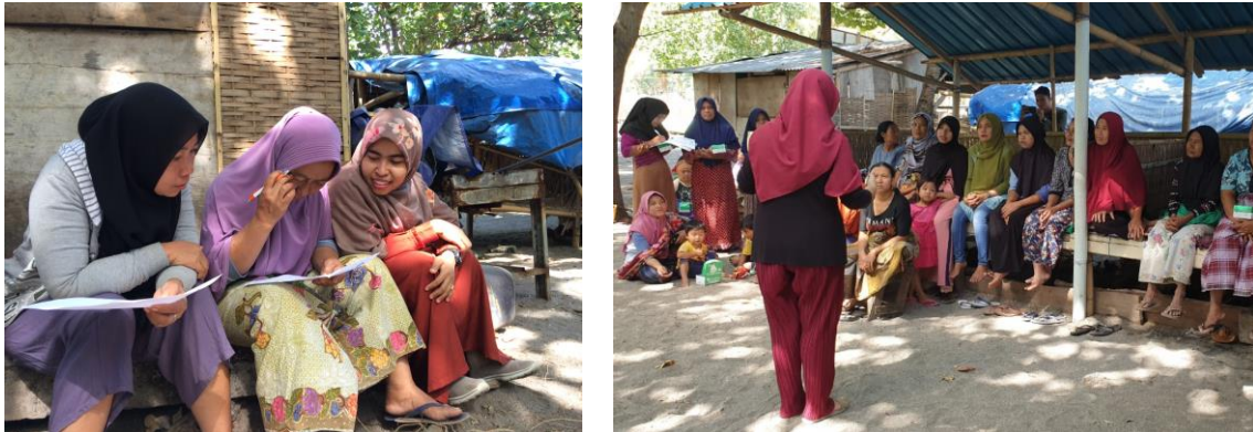
Gambar 2. Pengisian kuesioner oleh para pedagang sebelum dilakukan penyuluhan, didampingi oleh salah satu tim pengabdian (kiri); penyuluhan dan edukasi oleh dosen pakar dihadapan para pedagang di Pantai Nipah (kanan)

Salah satu sub kajian yang disampaikan adalah pencegahan gejala IMS pada saat hubungan seksual dengan suami menggunakan kondom. Para partisipan memberikan respon positif terhadap materi tersebut karena selama ini para pedagang tersebut masih menganggap penggunaan kondom adalah hal yang tabu ketika gejala IMS menyerang. Hal ini senada dengan hasil riset yang menyatakan bahwa sekitar 61,4% ibu rumah tangga tidak menerapkan perilaku pencegahan IMS termasuk HIV/AIDS dengan kondom. Salah satu faktor hal tersebut dapat terjadi karena ibu rumah tangga merasa tidak melakukan perilaku berisiko berhubungan seks dengan pasangan dan malu mengatakan mengenai kesehatan reproduksi yang dialami (Abhinaja and Astuti, 2013).