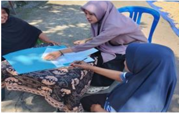
Gambar 3. Peserta mengisi daftar hadir kegiatan Kelompok Ukhuwah Datu Nusantara di Desa Sambik Bangkol, Kecamatan Gangga