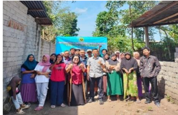
Gambar 4. Foto bersama dengan peserta pengabdian Kelompok Ukhuwah Datu Nusantara di Desa Sambik Bangkol, Kecamatan Gangga