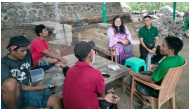
Gambar 1. Survei awal, wawancara pengurus dan anggota Kelompok Ukhuwah Datu Nusantara di Desa Sambik Bangkol, Kecamatan Gangga

Pada akhir diskusi, peserta menanyakan inti dari solusi yang ditawarkan. Tim Pengabdian menjelaskan bahwa untuk meningkatkan manajemen dalam usaha budidaya kurma, pelaku usaha harus memiliki keahlian dan keterampilan dalam melakukan pembukuan atas usahanya, seperti mencatat biaya produksi, perawatan, hingga hasil penjualan secara akuntabel. Hal tersebut menciptakan keadilan dalam bagi hasil, memperkuat strategi keuangan masyarakat, serta membuka peluang kerja baru di sektor agribisnis. Lebih lanjut, sistem pembukuan yang baik mendukung pengembangan produk olahan kurma secara profesional sehingga mampu memperkuat daya saing.