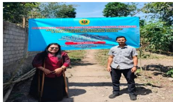
Gambar 2. Foto ketua dengan anggota Kelompok Ukhuwah Datu Nusantara di Desa Sambik Bangkol, Kecamatan Gangga